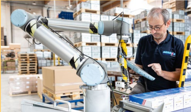
schmid schrauben hainfeld

Ein anderer Blick auf (neue) Themen ist zukunftsweisend